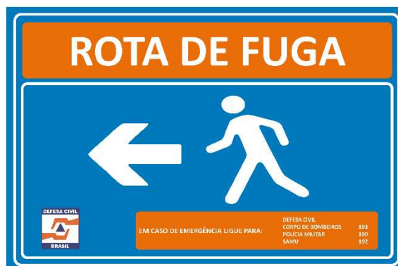
Figura 2 - Modelo de Placa de Rota de Fuga (Seta para a Esquerda).